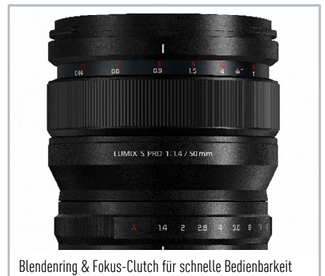
Blendenring & Fokus-Clutch für schnelle Bedienbarkeit