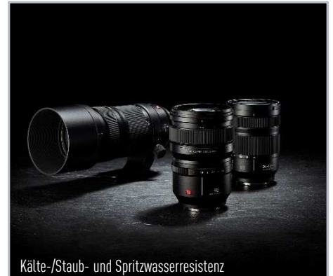
Kälte-/Staub- und Spritzwasserresistenz

LUMIX S Pro Referenzobjektiv – höchste Auflösung bis an den Rand Lichtstärke F1,4 bei 50mm – hohe Freistellung und perfektes Bokeh Robustheit – Staub-, Spritzwasser- und Kälteresistent Schneller & präziser Autofokus - Doppeltes Fokussystem (Linear- und Schrittmotor), 480 Hz Ansteuerung Intuitive Bedienung - Blendenring & Fokus-Clutch Hochwertige Konstruktion - 13 Linsenelemente in 11 Gruppen, 3 asph., 2 ED